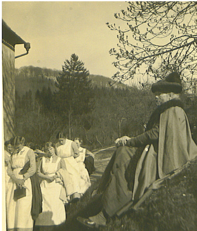
Ida von Kortzfleisch im Jahre 1912

Die Ausbildungsstätten, die Ida von Kortzfleisch ins Leben rief, füllten eine Lücke im Bildungswesen, nahmen Einfluss auf die Landflucht, die Landfrauenbewegung und auf das ländlich-hauswirtschaftliche Schul- und Lehrlingswesen. Für die gesamte Land- und Volkswirtschaft ist die Bedeutung der Reifensteiner Schulen nicht zu unterschätzen.